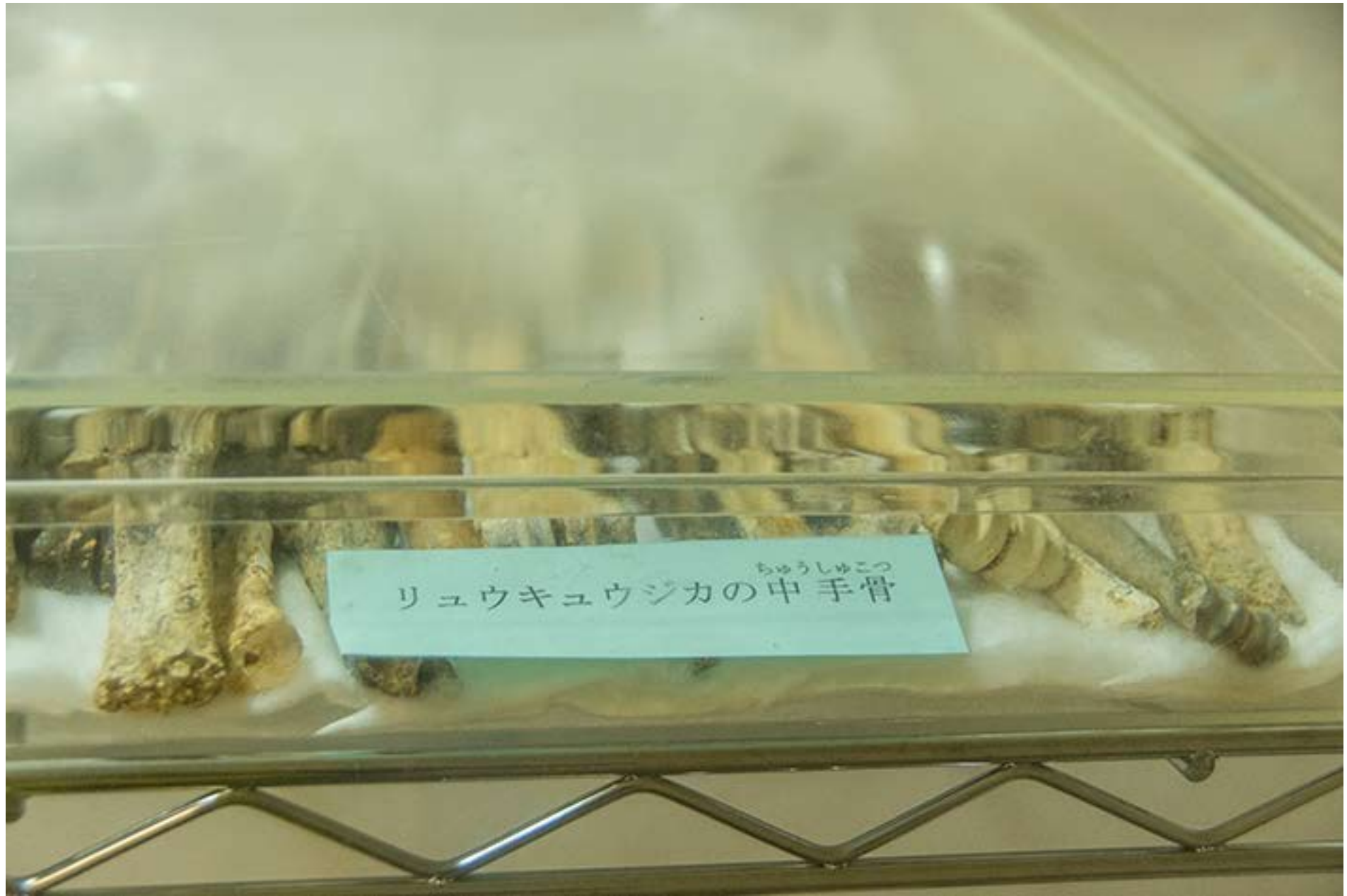
リュウキュウジカの中手骨